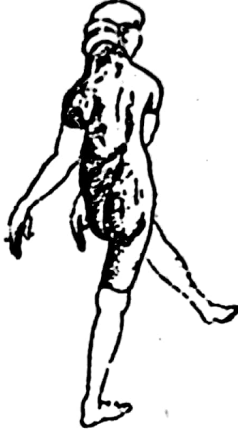
पाषाण की नृत्यमुद्रा मूर्ति

रूप से उल्लेखनीय हैं। पहली मूर्ति लाल बलुए पत्थर की तथा दूसरी काले पत्थर की बनी है। दोनों ही मूर्तियों के मस्तक तथा पैर टूटे हुए हैं। पहली मूर्ति किसी सीधे खड़े हुए पुरुष की है। इसकी गर्दन के ऊपर, कन्धों के निचले भागों तथा जंघों के नीचे छेद बने हुए हैं जो किसी बरमें द्वारा उकेरे हुए लगते हैं। ऐसा प्रतीत होता है कि शरीर के विविध अंगों जैसे मस्तक, हाथ, पैर आदि को अलग-अलग बनाकर किसी मशाले द्वारा जोड़ने की प्रथा उस काल में प्रचलित थी। दुर्भाग्यवश